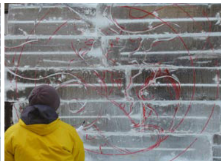
原画に合わせて下絵を描く