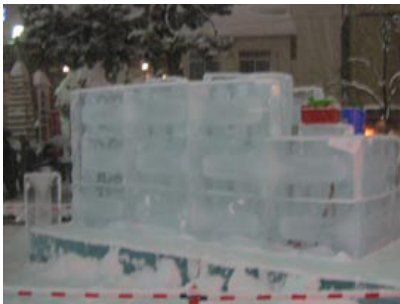
氷柱は台座 36 本、おひなさま 20 本使用