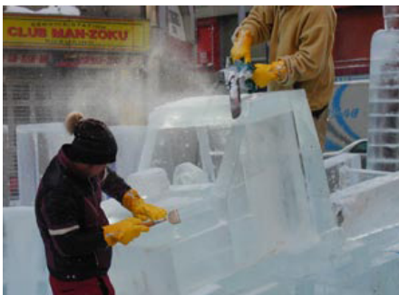
ノミや電動ノコギリで荒削り & 彫刻