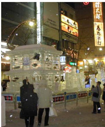
北海道の魚介を埋め込んだ「氷の龍宮城」& お酒の氷像。4000有余のススキノの飲食店にいざなう