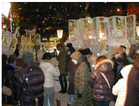
場所の力か、おひなさまパワーか!? 撮影スポットとして押すな押すなの人気

開会式：2月5日 18:30 氷の女王撮影会：2月5日 19:30 氷彫刻コンクール：2月5日～6日 表彰式：2月6日 11:00 氷像人気コンテスト 閉会式2月11日 21:45