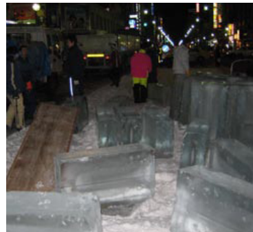
1 個 120kg の氷柱を運び込む