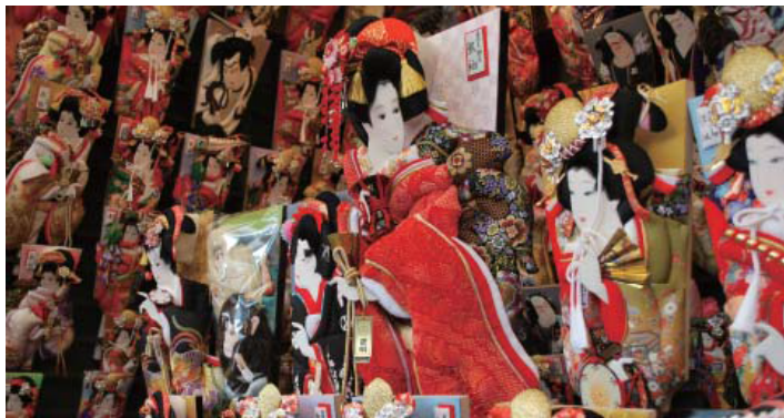
毎年恒例の浅草寺「羽子板市」。今回は天候にも恵まれ、会場（五重塔前）は多くの来場者で賑わった