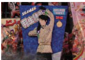
◀世界新記録を打ち立てたことで話題になったフィギュアスケート選手羽生結弦さんも登場