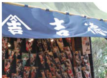
50余店の露店には趣向を凝らした羽子板がずらり。購入者への縁起の良い三本締め（三本締め）の音が鳴り響く